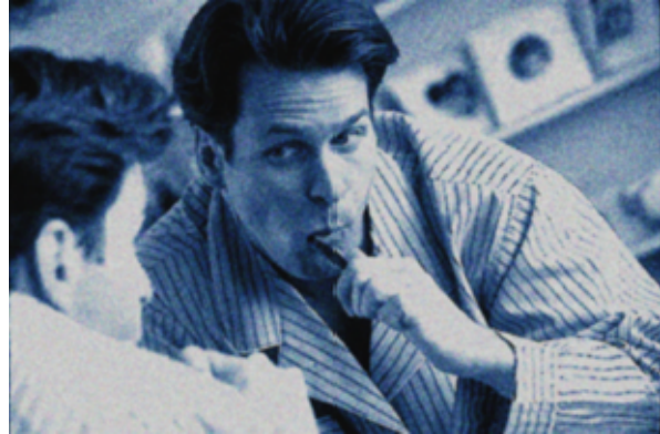
Abendfragen – z.B. beim Zähneputzen