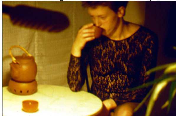
Abendfragen – z.B. beim Abendtee