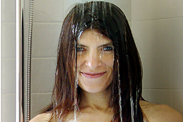
Morgenfragen – z.B. in der Dusche